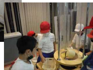
【エキスポセンター】